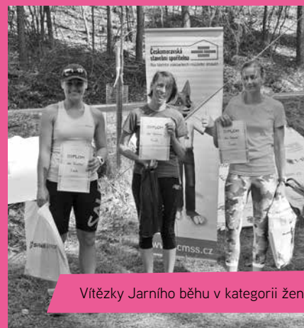
Vítězky Jarního běhu v kategorii ženy

Velkou radost nám udělala silná účast domácích závodníků, kteří tvoří prima partu. Domácím atletům se velmi dařilo a jako družstvo jasně dominovali. Mezi družstvy Zajícovy ligy (SK Atletika Hus-topeče, TJ Sokol Přisnotice, AC Moravský Krumlov, TJ Oslavany) získali cenné vítězství. Naši atleti jsou velmi šikovní a neustále to dokazují na nejrůznějších závodech. Je moc příjemné vidět, jak se vzájemně podporují a fandí si.