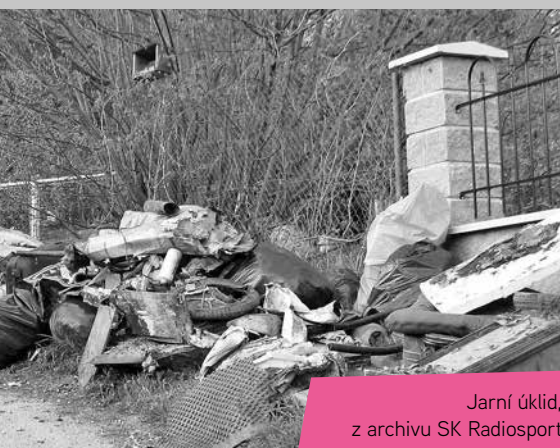
Jarní úklid