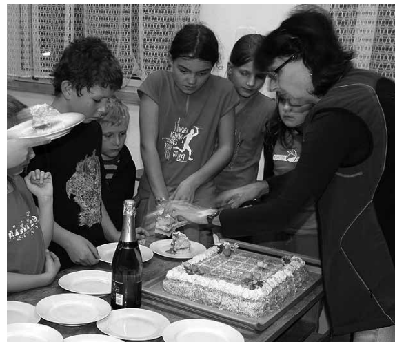
Z letošního ukončení sezóny

Z Bílovic jelo celkem do Kazachstánu 10 závodníků, kteří dohromady získali 15 medailí (5-4-6) z toho 8 individuál-